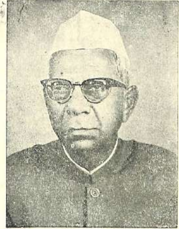
कै. ह. वि. पाटसकर