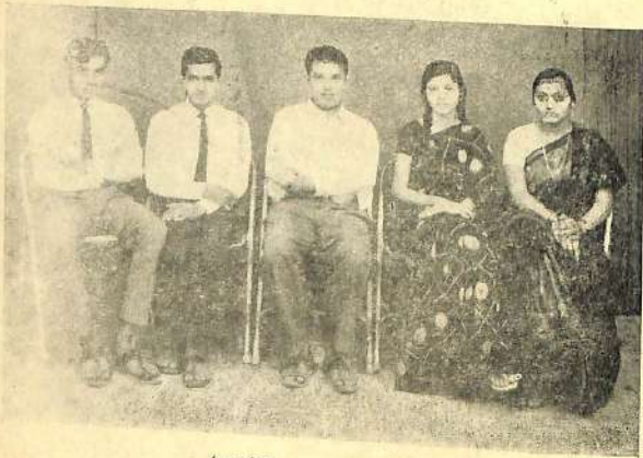
'कावळे' ह्या नाटकेतील कलावंत.